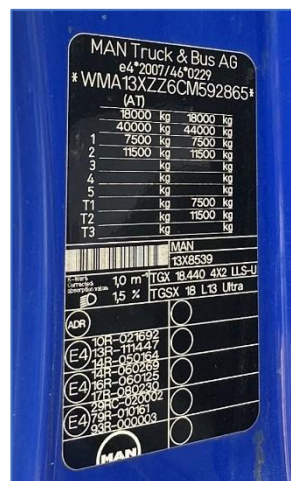
Slike 1. do 9.: Prikaz općeg stanja teretnog automobila